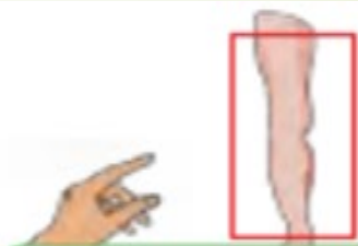
This is my leg.