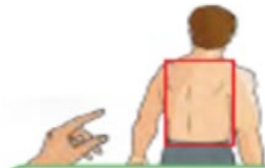
This is my back.