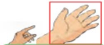
This is my hand.