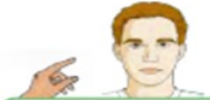
This is my head.